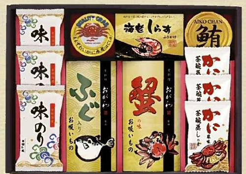
京料理おが和監修 お吸いもの詰合せ KO-EOA 税抜 5,000円 (税込 5,400円)

内容 / 蟹の味お吸いもの3.8g×3袋、ふぐ入りお吸いもの3.2g×3袋、 かに風味茶碗蒸しの素3袋、海老しらすふりかけ3g×3袋、 まるすわいがにほくしみ55g、鰹油漬フレーク70g 箱サイズ / 285×300×70mm 梱 / 10