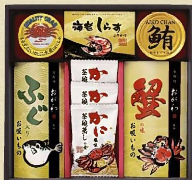
京料理おが和監修 お吸いもの詰合せ KO-DOA 税抜 4,000円 (税込 4,320円)

内容 / 蟹の味お吸いもの3.8g×3袋、有明海産味のり8切5枚×3袋、 かに風味茶碗蒸しの素3袋、鰹油漬フレーク70g、 海老しらすふりかけ3g×3袋 箱サイズ / 285×300×70mm 梱 / 10