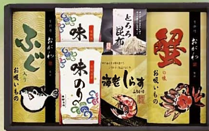
京料理おが和監修 お吸いもの詰合せ KO-BEA 税抜 2,500円 (税込 2,700円)

内容 / 蟹の味お吸いもの3.8g×3袋、 ふぐ入りお吸いもの3.2g×3袋、とらろ昆布1.5g×3袋、 海老しらすふりかけ3g×3袋 箱サイズ / 205×300×70mm 梱 / 20