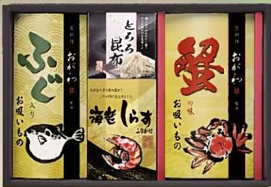
京料理おが和監修 お吸いもの詰合せ KO-BOA 税抜 2,000円 (税込 2,160円)

1976年生まれ千葉県出身。20歳で料理の世界に入り嵐山吉兆、祇園さゝ木で14年の修行を経て2010年に祇園にて独立、伝統的な技法と型にとらわれない柔軟な発想の料理をコースで提供。2022年より現在の烏丸御池に移転オープンし、ミシュラン一つ星を獲得。