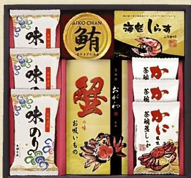
京料理おが和監修 お吸いもの詰合せ KO-CEA 税抜 3,500円 (税込 3,780円)

内容 / 蟹の味お吸いもの3.8g×3袋、 ふぐ入りお吸いもの3.2g×3袋、とらろ昆布1.5g×3袋、 海老しらすふりかけ3g×3袋、かに風味茶碗蒸しの素3袋 箱サイズ / 210×345×70mm 梱 / 20