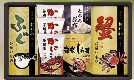
京料理おが和監修 お吸いもの詰合せ KO-COA 税抜 3,000円 (税込 3,240円)

内容 / 蟹の味お吸いもの3.8g×3袋、 ふぐ入りお吸いもの3.2g×3袋、とらろ昆布1.5g×3袋、 海老しらすふりかけ3g×3袋、有明海産味のり8切5枚×2袋 箱サイズ / 210×345×70mm 梱 / 20